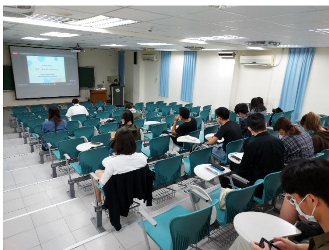
圖三、講座過程實況(一)