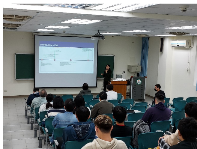
圖六、講座過程實況(四)