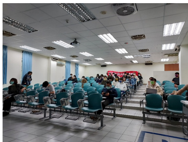
圖二、與校友合照(與海報或紅布條合照)