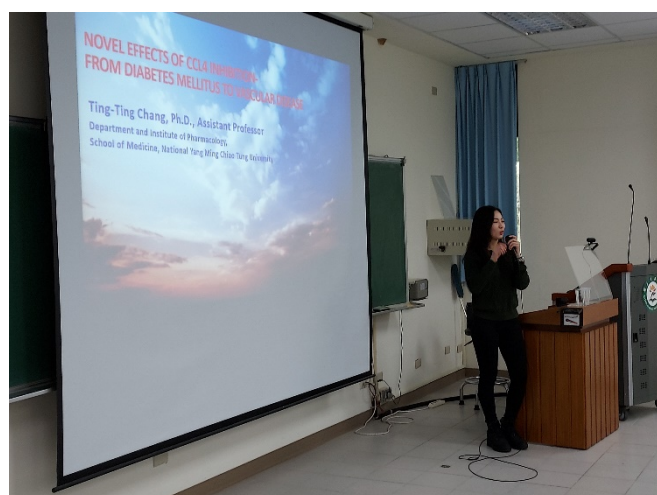
圖四、講座過程實況(二)