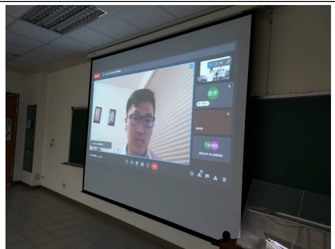
圖六、講座過程實況(四)