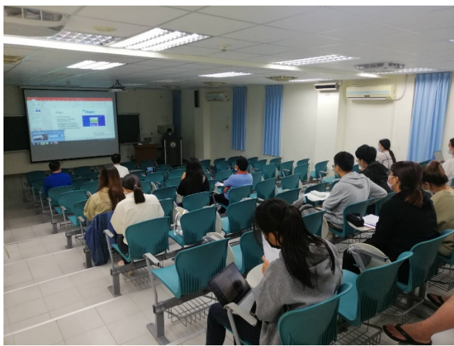
圖三、講座過程實況(一)