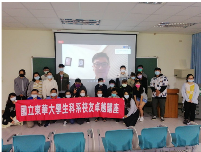
圖一、全體大合照(與校友及紅布條合照)