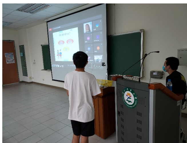
圖四、講座過程實況(二)