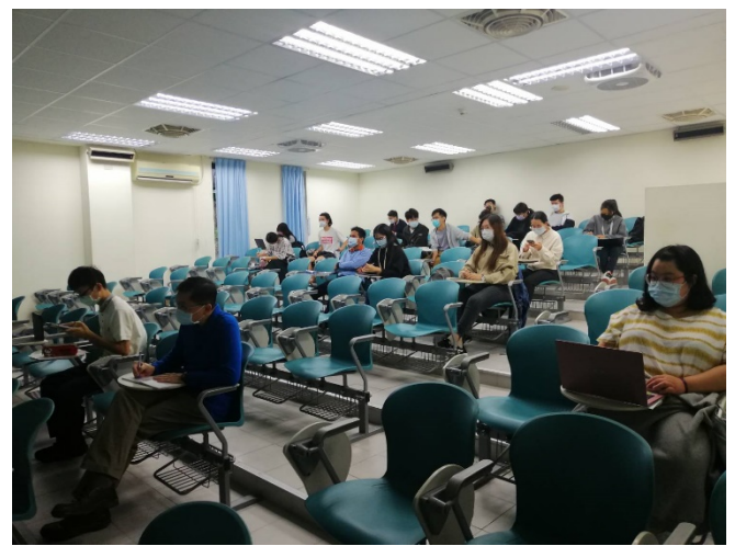
圖四、講座過程實況(二)