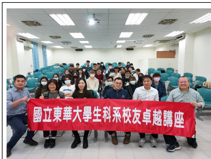
圖一、全體大合照(與校友及紅布條合照)