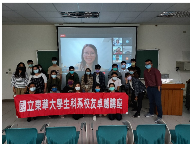
圖一、全體大合照(與校友及紅布條合照)