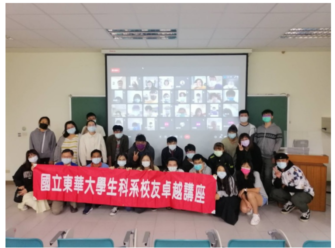
圖二、與校友合照(與海報或紅布條合照)