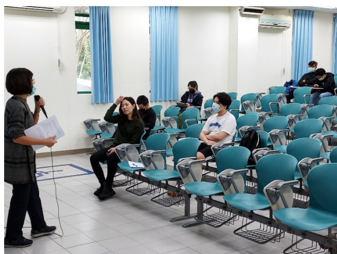
圖三、講座過程實況(一)