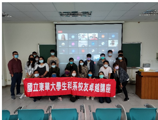
圖二、與校友合照(與海報或紅布條合照)