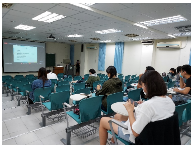
圖六、講座過程實況(四)