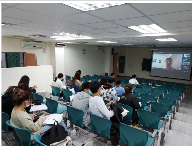
圖五、講座過程實況(三)