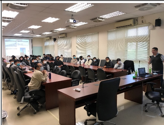
圖四、講座過程實況(二)