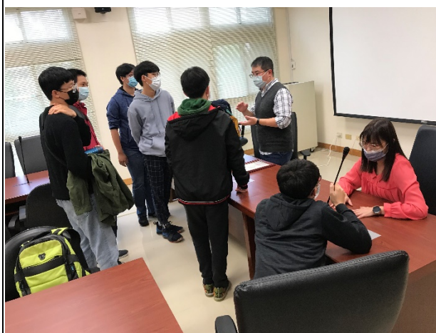
圖六、講座過程實況(四)