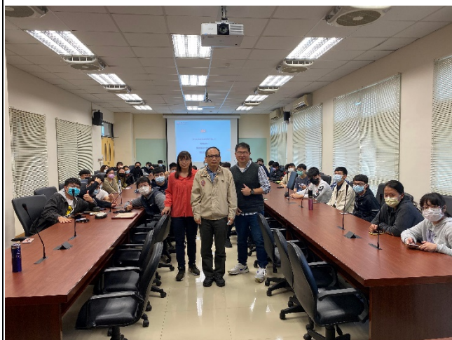
圖一、全體大合照(與校友及紅布條合照)