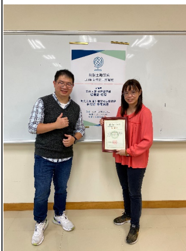
圖二、與校友合照(與海報或紅布條合照)