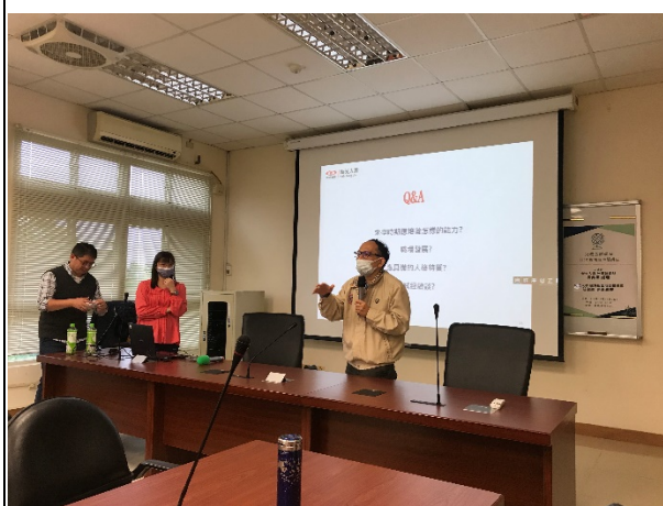
圖五、講座過程實況(三)