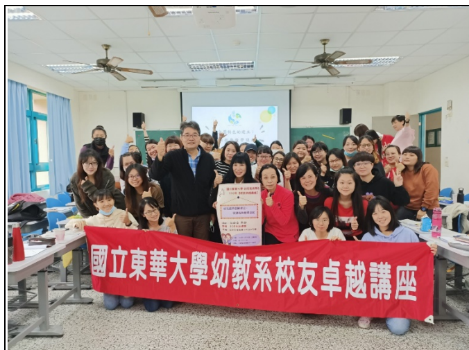
圖一、全體大合照(與校友及紅布條合照)