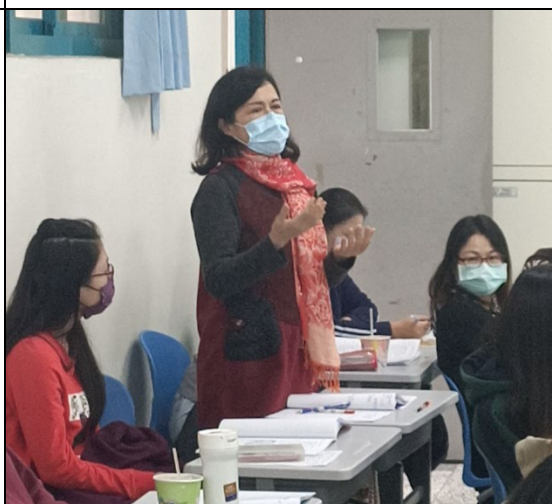
圖六、講座過程實況(四)