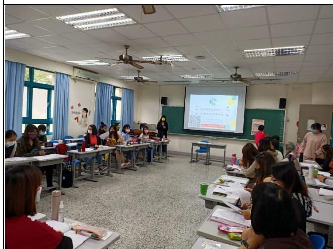
圖三、講座過程實況(一)