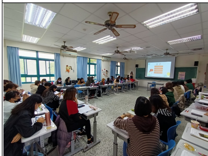
圖五、講座過程實況(三)