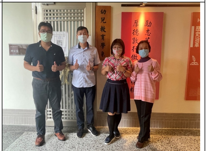
圖六、系主任與校友合照(四)