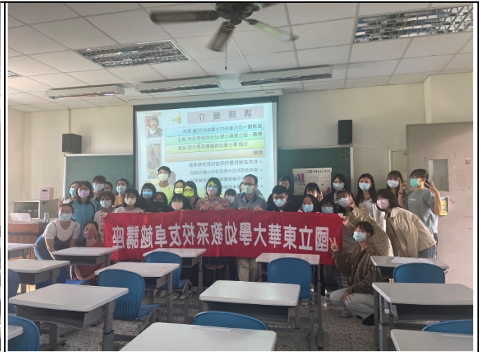
圖二、與校友合照(與海報或紅布條合照)