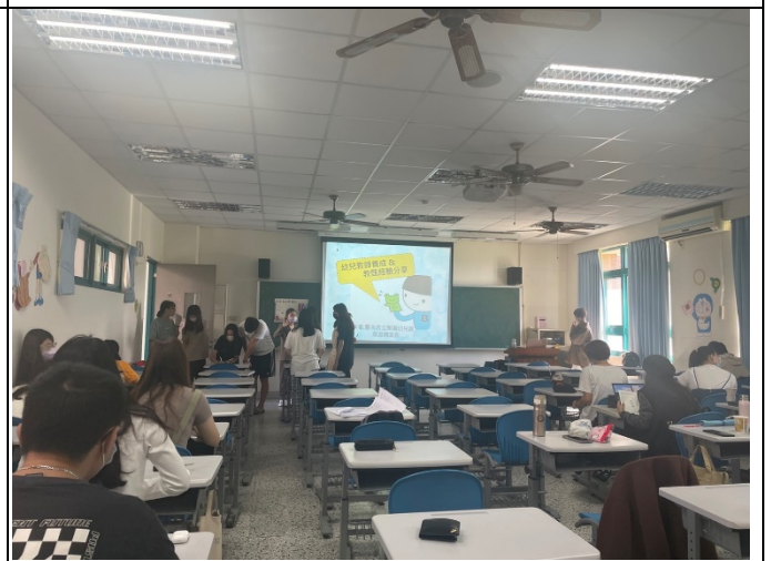
圖四、講座過程實況(二)