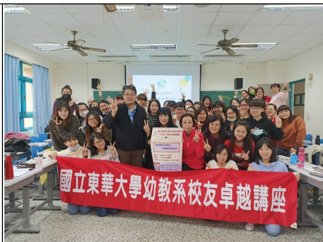
圖二、與校友合照(與海報或紅布條合照)