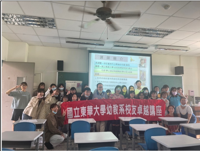
圖一、全體大合照(與校友及紅布條合照)