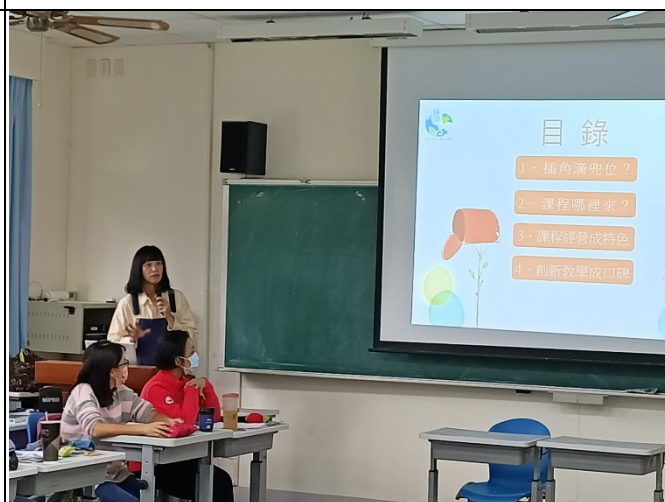
圖四、講座過程實況(二)