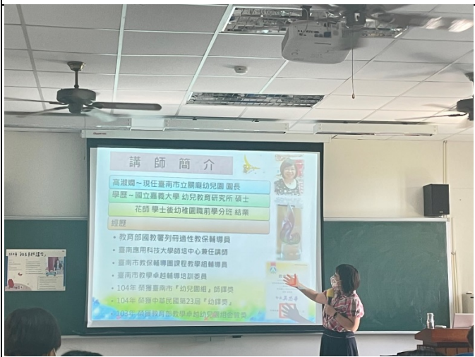
圖三、講座過程實況(一)