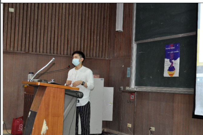
圖三、講座過程實況(一)