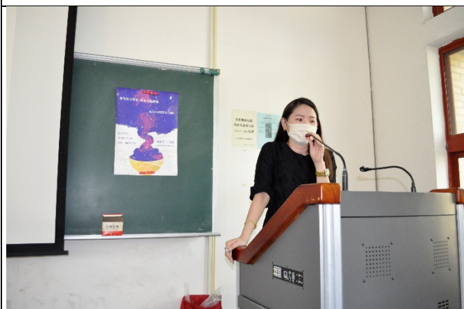
圖五、講座過程實況(三)