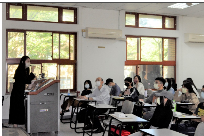
圖六、講座過程實況(四)