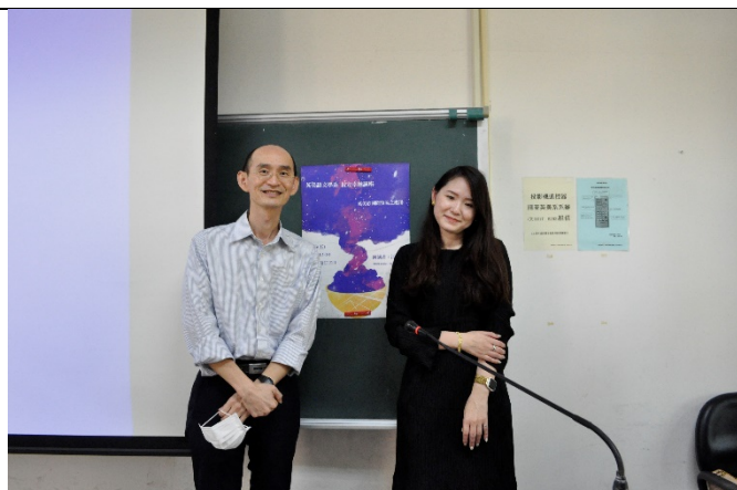
圖二、與校友合照(與海報或紅布條合照)