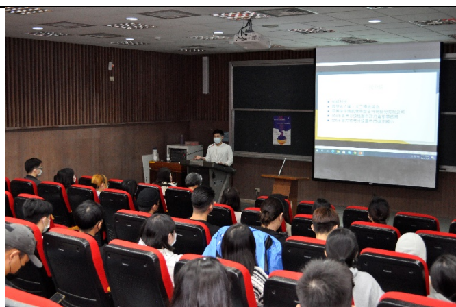
圖四、講座過程實況(二)