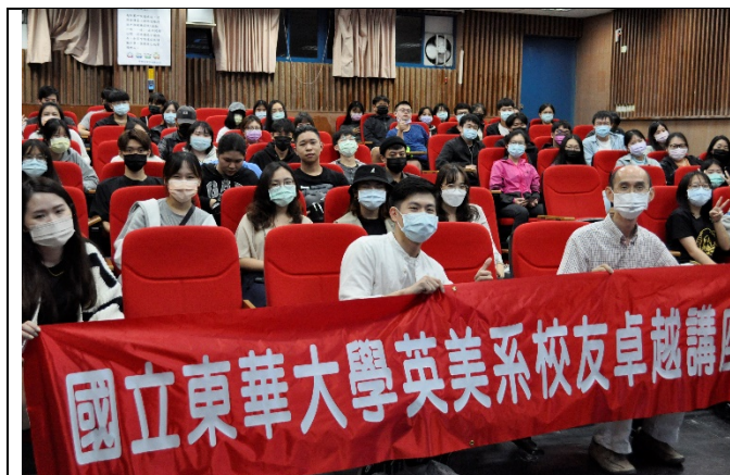
圖一、全體大合照(與校友及紅布條合照)