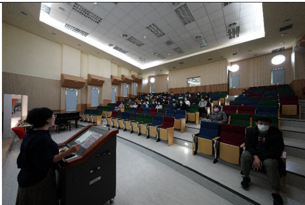
圖三、11/30 講座過程實況(一)