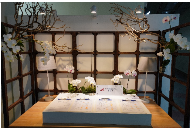
圖五、會場簽到處布置實況 (三)