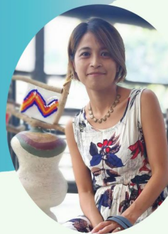
東海岸大地藝術節計畫主持人