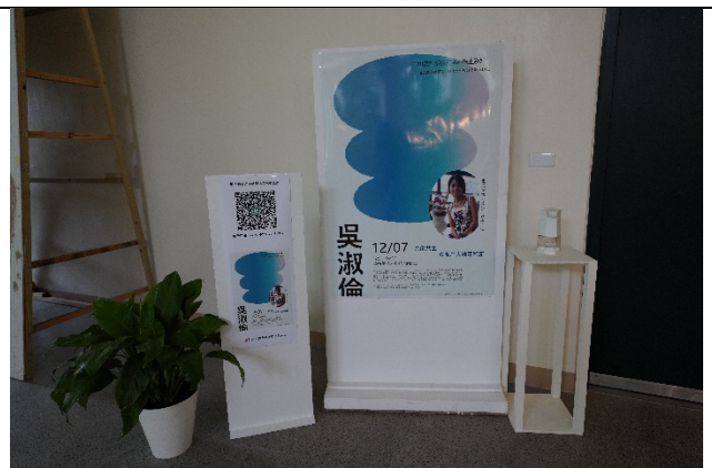
圖六、講座海報設置實況(四)