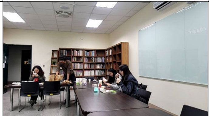
圖四、11/26 講座過程實況(二)