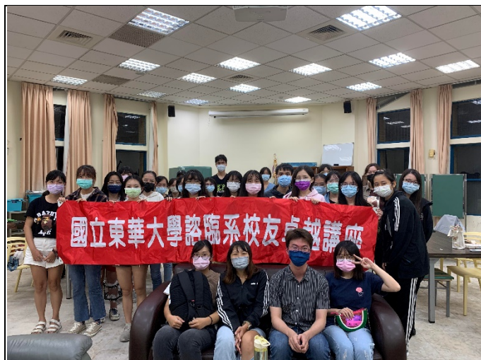
圖一、全體大合照(與校友及紅布條合照)