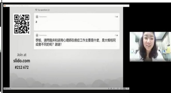
圖六、講座過程實況(四)