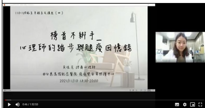
圖五、講座過程實況(三)