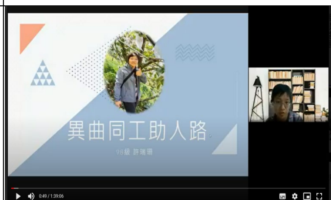
圖四、講座過程實況(二)