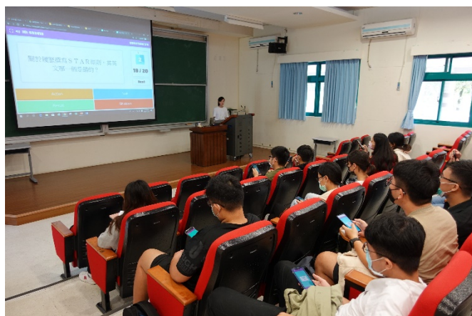
圖四、講座過程實況(二)-講者透過 Blooket 小測驗方式與同學手機回答互動