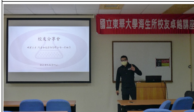
圖三、講座過程實況(一)