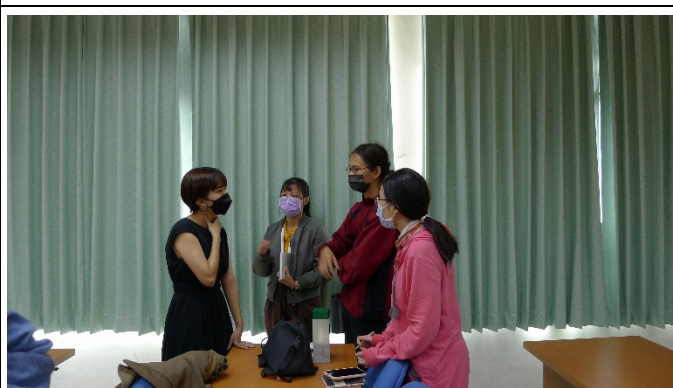
圖八、講座過程實況(六)