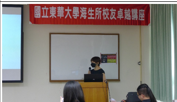
圖六、講座過程實況(四)