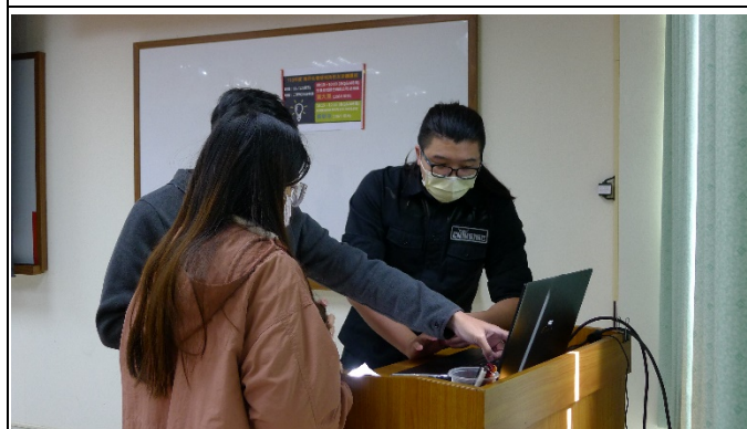
圖七、講座過程實況(五)