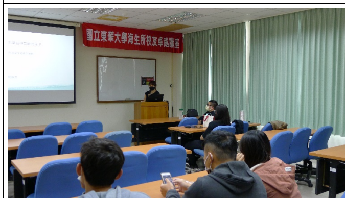
圖五、講座過程實況(三)