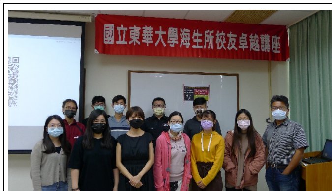
圖一、全體大合照(與校友及紅布條合照)