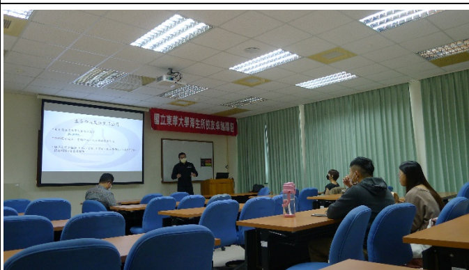
圖四、講座過程實況(二)